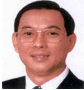
Tony Tan Caktiong

c. Pinakamayamang negosyanteng Pilipino na nagmamay-ari ng Asia Brewery, Allied Bank, Philippine Airlines, at Fortune Tobacco. Siya ay galing sa mahirap na pamilya mula sa Amoy, Fujian, China. Siya ay nagtrabaho habang nag-aaral upang msduportahan ang kanyang pamilya.