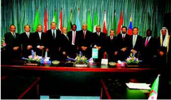
Ika-107 kumperensya ng OPEC sa Vienna, March 23, 1999

mabilis at regular na suplay sa mga bansang kumukonsumo ng langis at magkaroon din ng makatarungang tubo ang mga bansang nagpoprodyus ng langis.